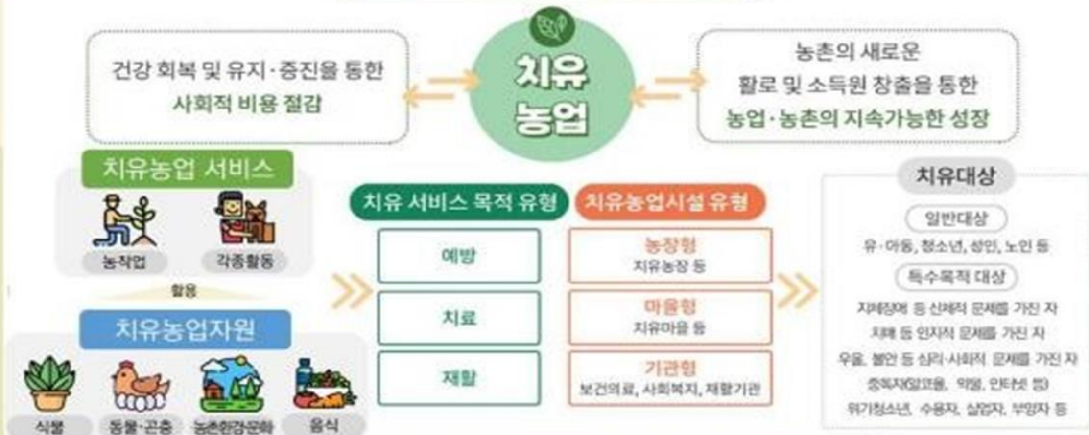
그림 1 한국형 치유농업 정책방향